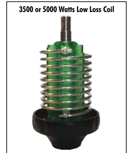
3500 or 5000 Watts Low Loss Coil