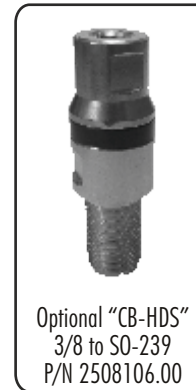
Optional "CB-HDS" 3/8 to SO-239 P/N 2508106.00