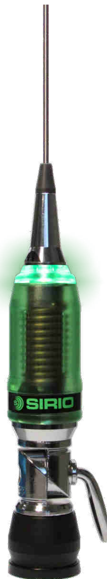
5000 Watts Low Loss Coil