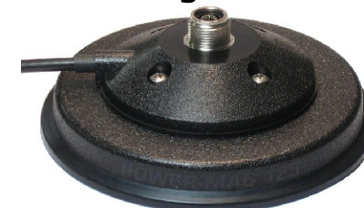
PM 125 POWER MAG magnetic mount 125mm, 3.6 m / RG 58

Upgrade: grazie al nuovo magnete multi-polo è stata aumentata la potenza magnetica del 20% /30% a seconda del tipo di installazione. Adesivo in PVC già assemblato.