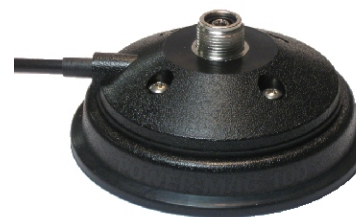
PM 100 POWER MAG magnetic mount 100mm, 3.6 m / RG 58