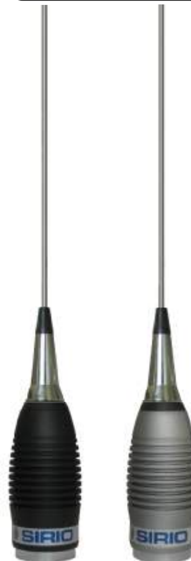
MW 4000 R black