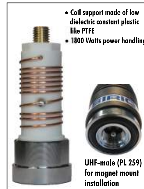
MW 4000 R silver